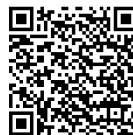
App für Android