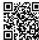
App für iOS

Jetzt App laden und Radverkehr verbessern!